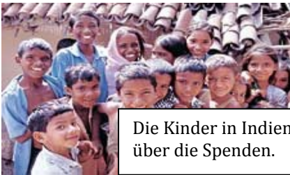
Die Kinder in Indien freuen sich über die Spenden.

Weihnachten ist die Zeit der Liebe und des Gebens. Schüler und Schülerinnen des Gymnasiums in Pritzwalk veranstalteten am 15.12.2010 eine Hilfsaktion. Sie sammelten Spenden für die Hilfsaktion "Asha Vihar". Die Schüler und Schülerinnen machten einen Tanzabend und nahmen Geld ein. Das ist für ein Kinderdorf für Waisen, eine Schule und ein Krankenhaus für die Armen in Indien.