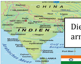
Die Spenden sind für arme Menschen in Indien.

Das Schulprojekt ist jedes Jahr ein großer Erfolg und eine große Hilfe für Indien besonders an Weihnachten.