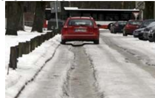
Eine mehrere Zentimeter dicke Eisschicht auf einer Straße in Hamburg.

Ein Mensch rutscht auf eisglattem Fußweg aus. Solche Bilder soll es in Hamburg in diesem Jahr nicht geben. Der Winter ist da, mit soviel Eis und Schnee. Auf Straßen und Fußwegen in Hamburg herrscht Chaos. Bei Temperaturen von bis zu -15 Grad wird es auch weiterhin glatt bleiben. Ab Mittwoch ist wieder mehr Schnee zu erwarten.